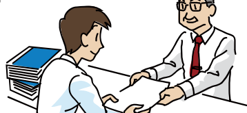
申請受付、受付印押印