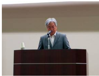
岩手労働局 小田課長