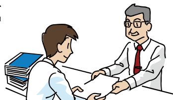
申請受付、受付印押印