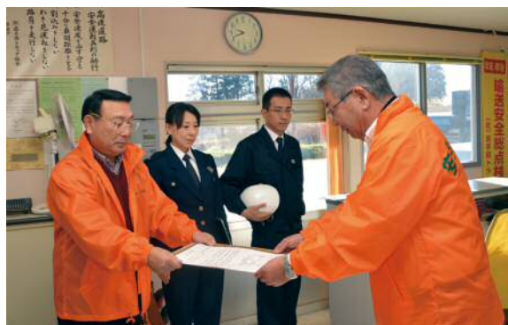
12月2日 水沢支部パトロールにて（要請書手交の様子）

※中央支部パトロール件数の内（8件）は、他支部加入、中央支部未加入の事業所の巡回件数。