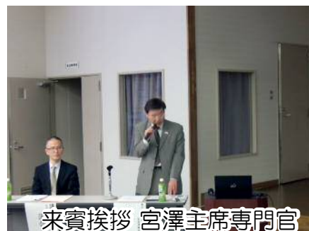
来賓挨拶 宮澤首席専門官